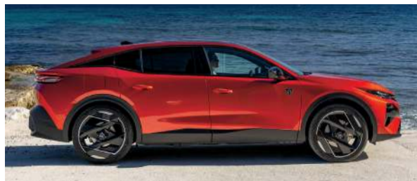
De profil, impossible de distinguer la 408 restylée de l'ancienne ! Cette "crossberline" se démarque toujours par sa garde au sol surélevée et ses éléments de carrosserie en plastique brut.

Les progrès semblent très nets aussi en matière de consommation en mode hybride, une fois la batterie vide : nous avons relevé 6,3 l/100 km à l'ordinateur de bord lors de notre essai, alors que nous avons mesuré 7,8 l/100 km sur la précédente 408 "PHEV". En revanche, les éventuels gains en agrément mécanique sautent moins aux yeux, avec un moteur thermique