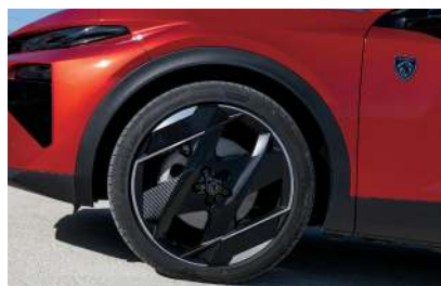
Ces jantes en alliage de 20" sont facturées 300 €. Mais l'option est discutable pour le confort, car elles engendrent quelques trépidations.

un peu trop bruyant à l'accélération (dommage, l'auto étant par ailleurs fort bien insonorisée) et une boîte trop souvent hésitante, notamment à basse vitesse. C'est aussi dans ce cas que le chuintement de la machine