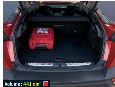
Volume : 441 dm 3