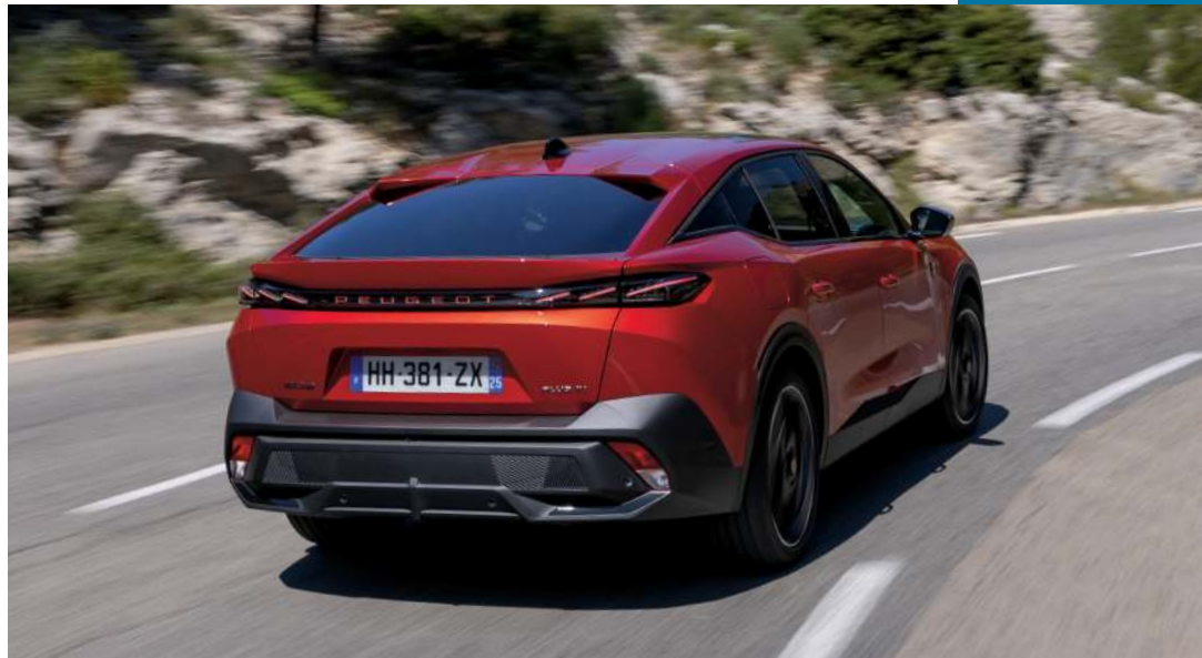
A l'arrière, les évolutions esthétiques de la 408 restylée se limitent au "Peugeot" en toutes lettres entre les feux, et illuminé ! Sur le plan technique, les changements sont plus importants : cette version hybride rechargeable a ainsi gagné 15 ch.